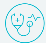
المستشفيات والمراكز الصحية Hospitals & Health Centers