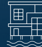
40 كم من الحياة على الواجهة البحرية 40 Km of Seafront Living