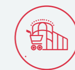
المراكز التجارية Retail Centers