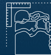
7 جزر بمساحة 10 كم 2 ومساحة إجمالية تبلغ 12 كم 2 7 Islands of 10 Km 2 & Total Area Spanning 12 Km 2