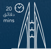
قلب العاصمة المنامة Manama City Center