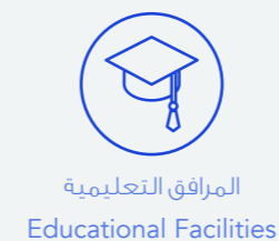
المرافق التعليمية Educational Facilities