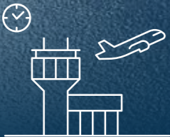
مطار البحرين الدولي Bahrain International Airport